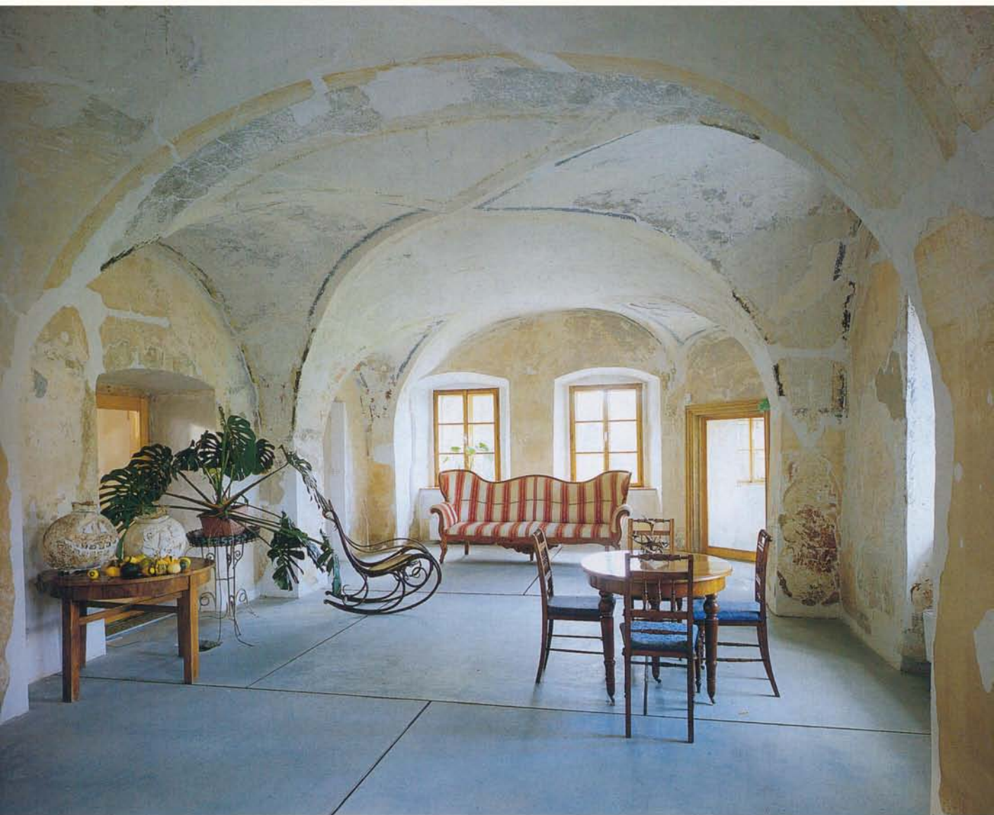
Nahoře: Společenský sál u vstupu v přízemí slouží jako jídelna a byl obnoven po dohodě s památkáři spojením tří menších místností. Na stěnách je restaurovaná renesanční vrstva malby s částečně zachovanými freskami. Dole: V jedné z prostorných ložnic zaujímá celou stěnu dílo umělkyně Anabel Howland: Lines. Z letadla vyfotografovala cesty v polích kolem zámku a přenesla je na fólii. Současné umění tu skvěle funguje se starožitným nábytkem.