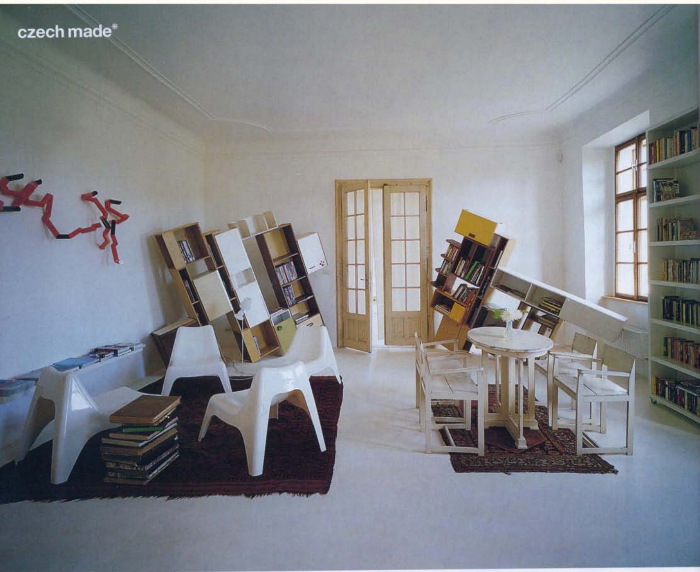
Nahoře: Knihovna v patře je vybavena regály Futura od Tomáše Lahody, které vytvořil původně pro Galerii Futura. Oranžová plastika od Thomase Wildnera na stěně se jmenuje Genom, zařízení je z pražských bazarů a IKEA, lampička Flap Flap z Konsepti. Dole: V koupelně se zapuštěným bazénkem má podlaha bazénový nátěr, a tak můžete napustit vodou celou místnost do výšky cca 10 cm. Koberec je stará ruční práce z Ukrajiny.