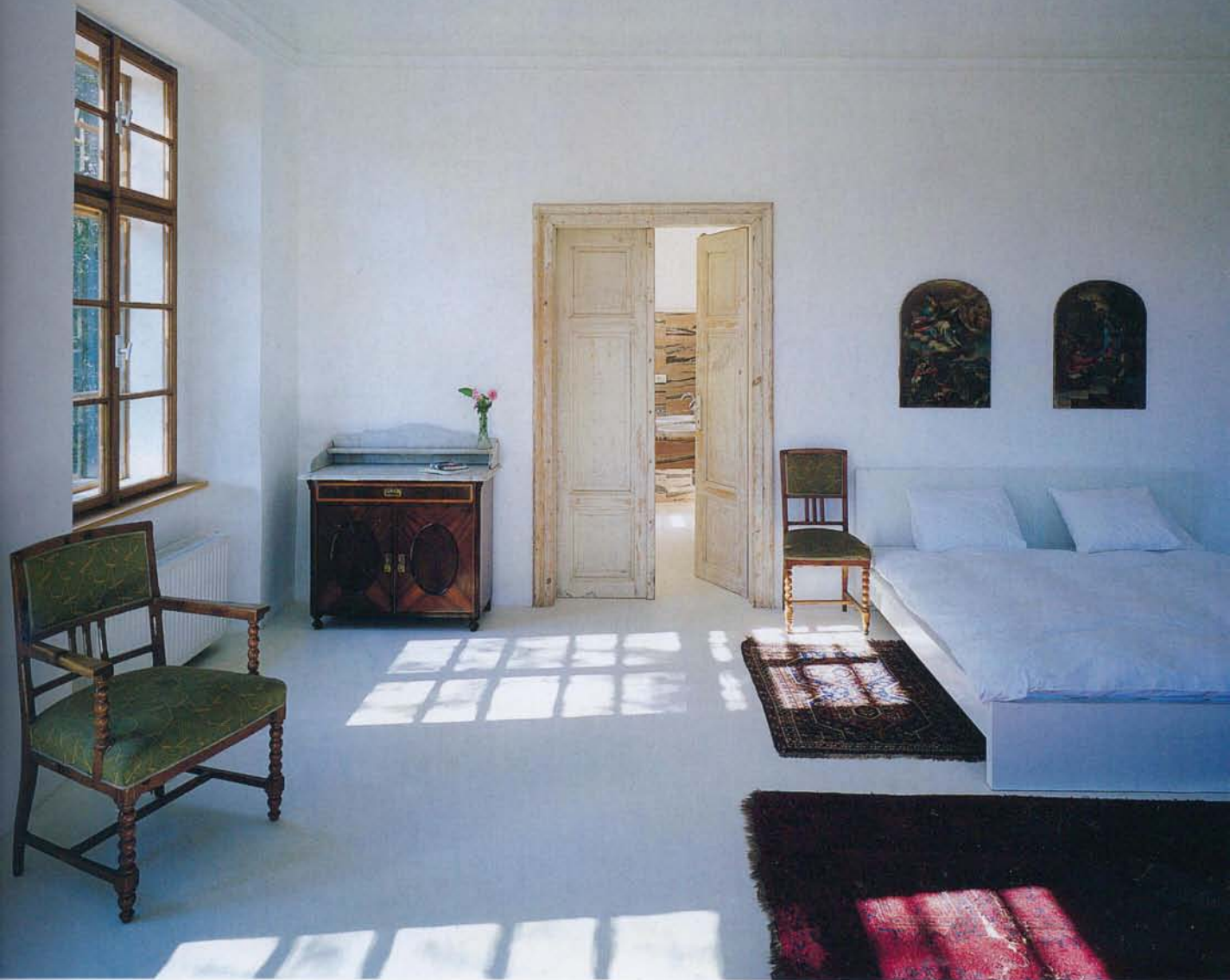
Nahore: Tento pokoj na svůj nový umělecký objekt teprve čeká, může se ale pochlubit koupelnou z růžového mramoru z Rajastánu a nerezovou vanou. Postel z IKEA opět doplňuje starý nábytek a české umění z 18. století. Dole: Dvě ze ložnic mají výklenky ve věžích vhodné k posezení s výhledem.